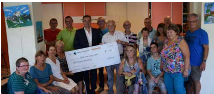
Le chèque a été remis le 18 septembre dernier dans les locaux de l'APF.

Les participants ont versés au minimum un euro symbolique. L'ensemble des inscriptions a permis de totaliser 560€, une somme doublée par notre partenaire, Viasanté. Au total, 1120€ ont été collectés, en faveur de l'Association des Paralysés de France, et remis lors d'une cérémonie dédiée le mardi suivant dans les locaux d'AG2R la Mondiale.