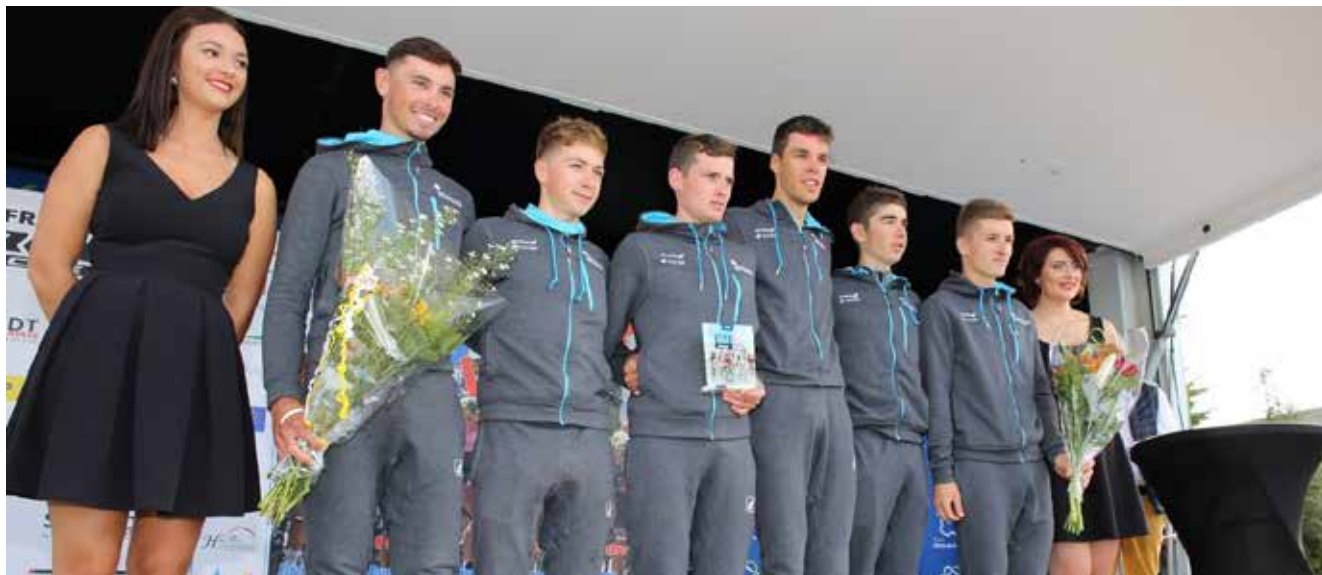
L'équipe de Chambéry CF récompensée lors de la dernière manche de Coupe de France.

Pour la quatrième année consécutive, Chambéry CF termine sur le podium de la Coupe de France DN1. Bilan des huit manches de l'édition 2018.